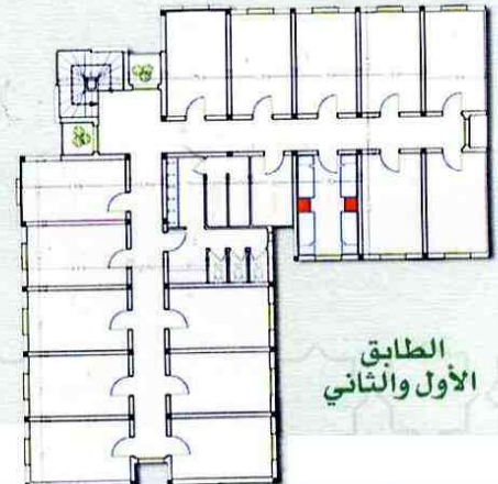
الطابق الأول والثاني

• المرافق : مطبخ ، مطعم ، قاعة للمطالعة، 3 مكاتب و 2 مرافق صحية